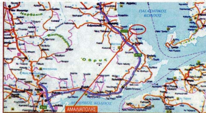
Στον Παγασητικό δίπλα στον Αλυμρό